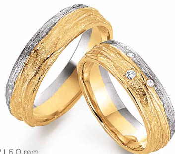
62 | 6.0 mm