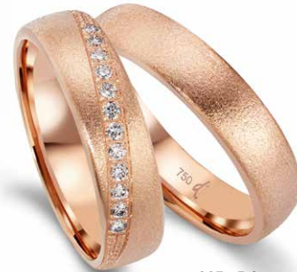
223 | 5.0 mm