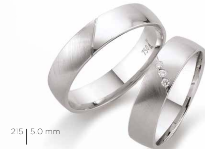
215 | 5.0 mm