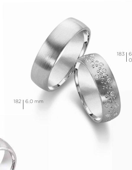
182 | 6.0 mm