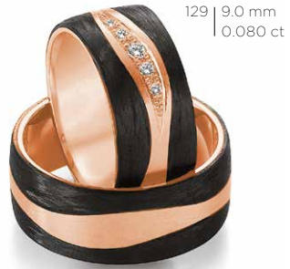
129 | 9.0 mm 0.080 ct