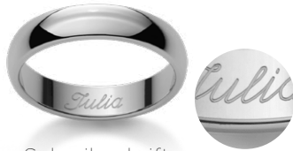
Schreibschrift Ecriture anglaise