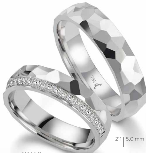
211 | 5.0 mm