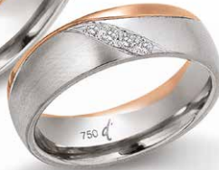
206 | 6.0 mm 0.050 ct