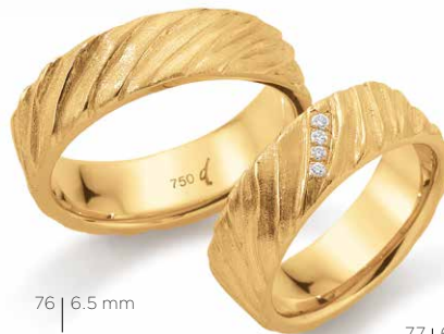
76 | 6.5 mm