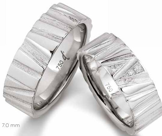
88 | 7.0 mm