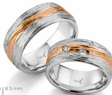
25 | 8.5 mm