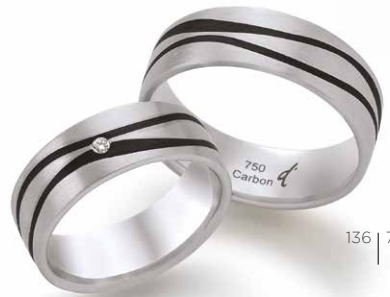
136 | 7.0 mm