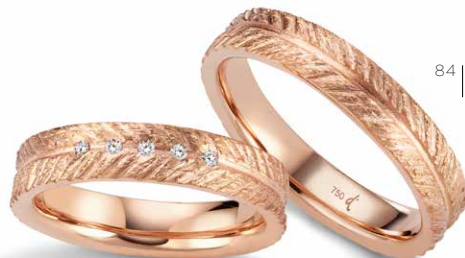
84 | 4.5 mm