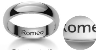
Blockschrift Caractères d'imprimerie