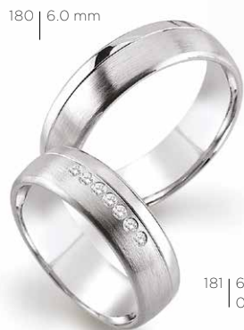
180 | 6.0 mm