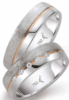
198 | 6.0 mm 0.075 ct