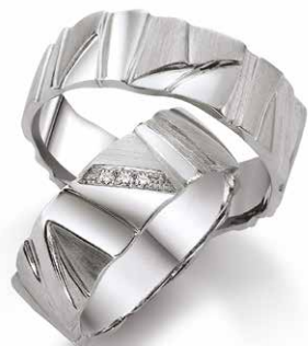
87 | 7.0 mm 0.030 ct