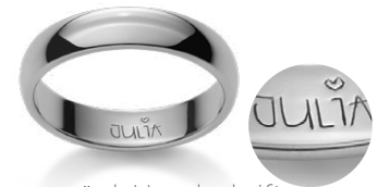
Ihre persönl. Handschrift Votre écriture personnelle