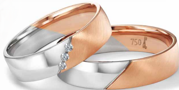
218 | 5.0 mm 0.030 ct