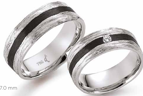
112 | 7.0 mm