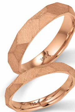
213 | 4.5 mm