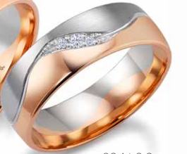
204 | 6.0 mm 0.040 ct