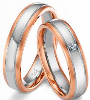
164 | 5.0 mm