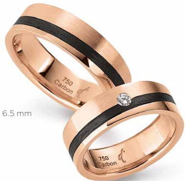
138 | 6.5 mm