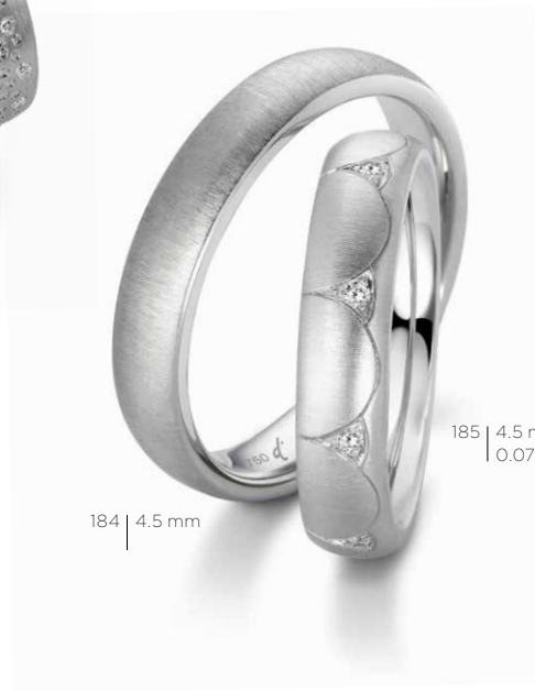
184 | 4.5 mm