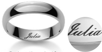
Schreibschrift Ecriture anglaise