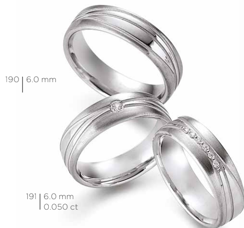
190 | 6.0 mm