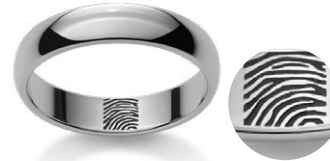
Fingerprint Empreinte digitale