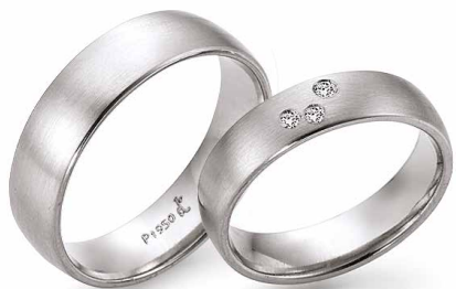
241 | 6.0 mm