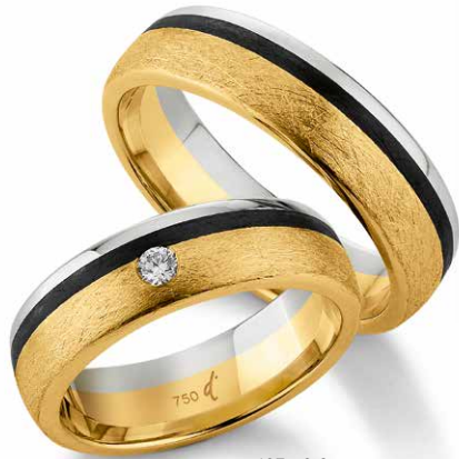
123 | 6.0 mm 0.050 ct