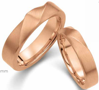
219 | 5.5 mm