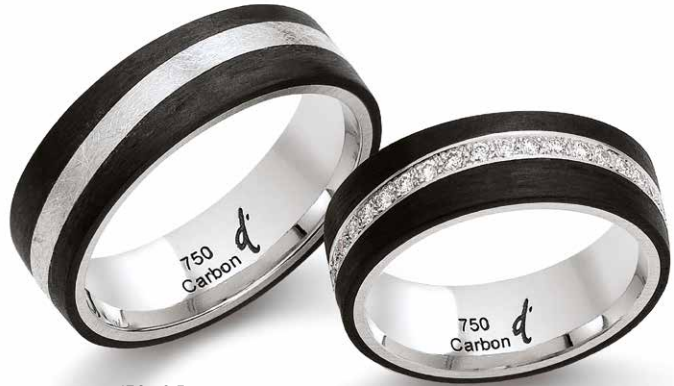
130 | 6.5 mm