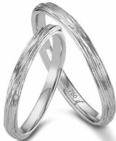
47 | 2.5 mm