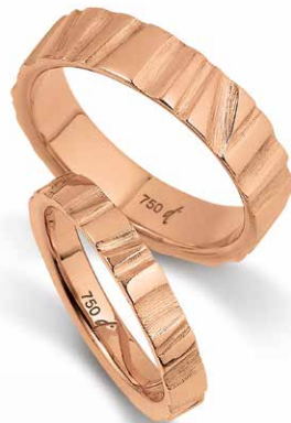
90 | 5.5 mm