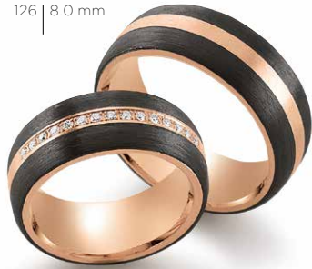
126 | 8.0 mm