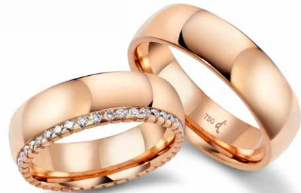
173 | 6.5 mm 0.513 ct