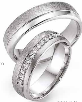
176 | 6.0 mm