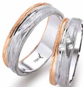
31 | 6.0 mm