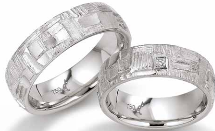
56 | 6.5 mm