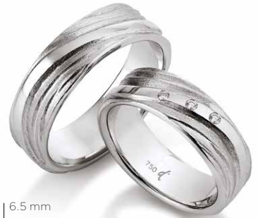
92 | 6.5 mm