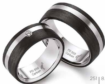
251 | 8.0 mm