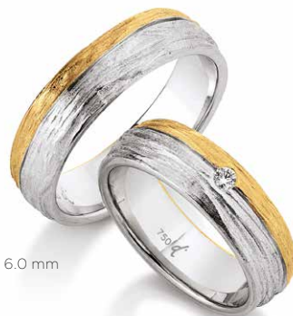
64 | 6.0 mm