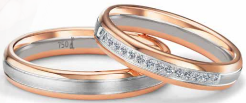
166 | 4.0 mm