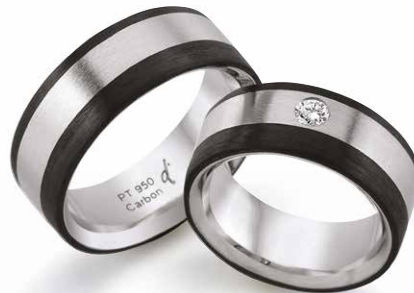
243 | 8.0 mm