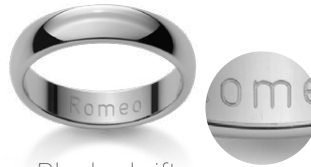
Blockschrift Caractères d'imprimerie