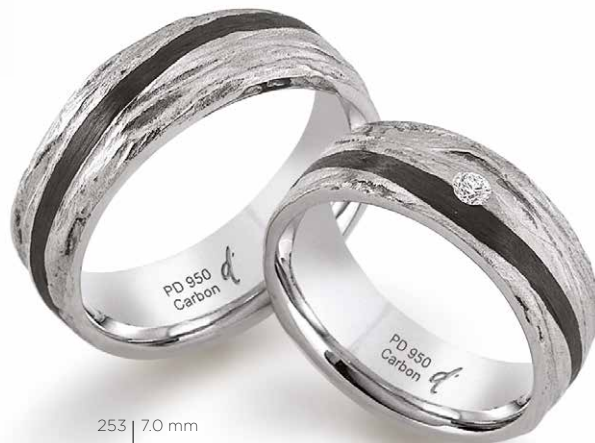
253 | 7.0 mm