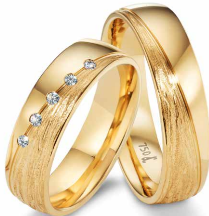
16 | 5.5 mm 0.050 ct