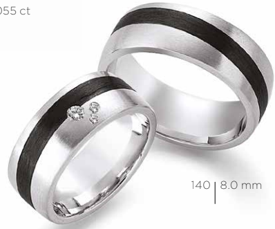
140 | 8.0 mm