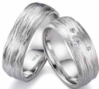
21 | 7.0 mm