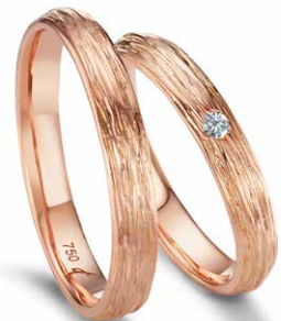
48 | 3.5 mm