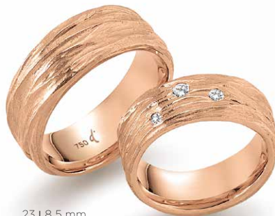
23 | 8.5 mm