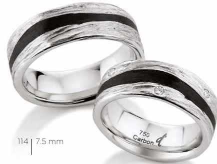
114 | 7.5 mm