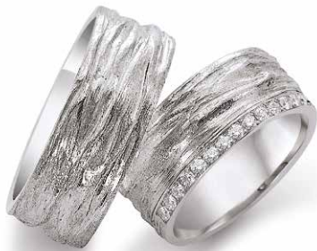
11 | 8.5 mm