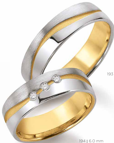
193 | 6.0 mm