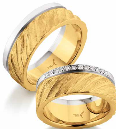
74 | 8.5 mm