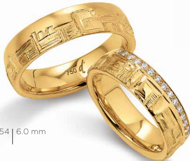
54 | 6.0 mm