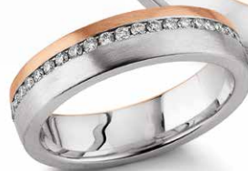
200 | 5.0 mm 0.220 ct