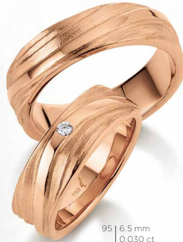
94 | 6.5 mm