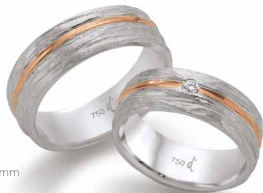
29 | 7.0 mm