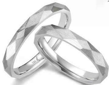
209 | 3.0 mm