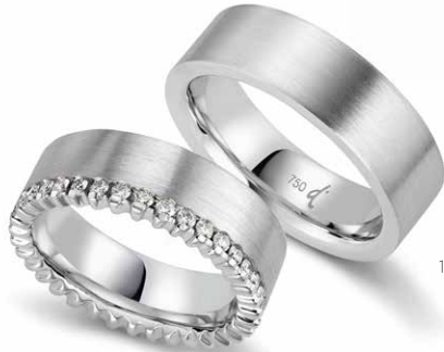
168 | 7.0 mm