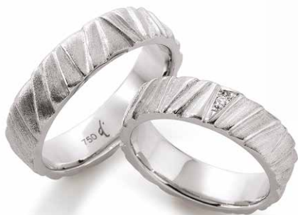
72 | 5.5 mm