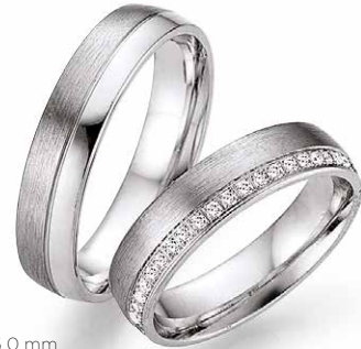
178 | 5.0 mm