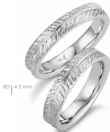
80 | 4.5 mm