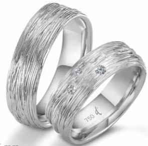
50 | 6.5 mm