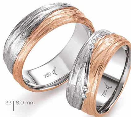
33 | 8.0 mm