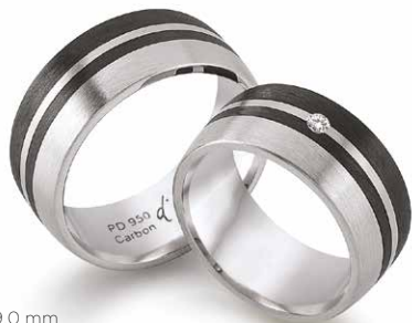
249 | 9.0 mm