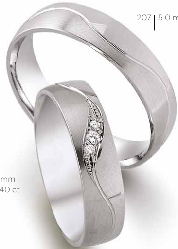
207 | 5.0 mm