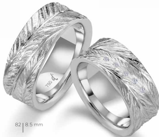
82 | 8.5 mm