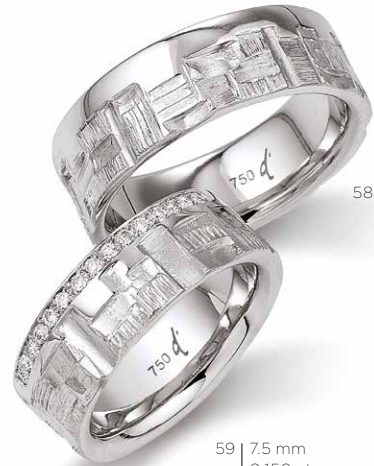
58 | 7.5 mm