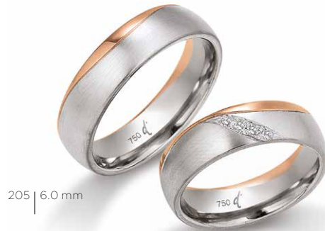
205 | 6.0 mm