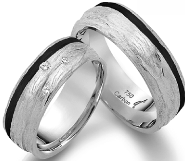
110 | 7.0 mm