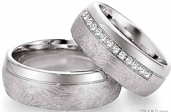
174 | 8.0 mm