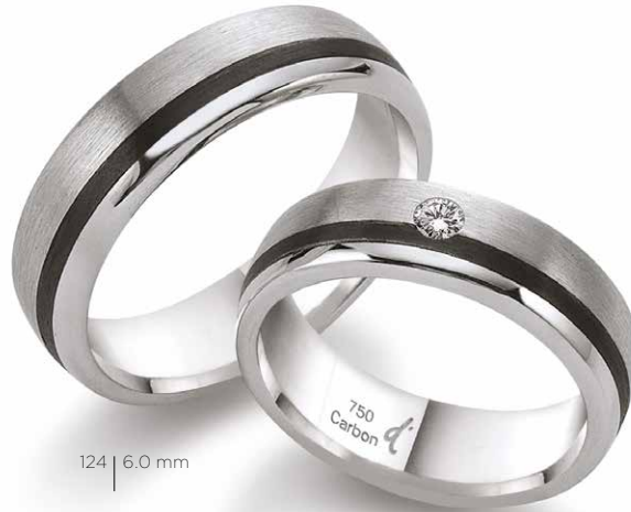
124 | 6.0 mm