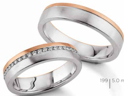
199 | 5.0 mm